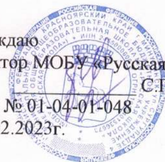
График работы смены оздоровительного лагеря с дневным пребыванием детей